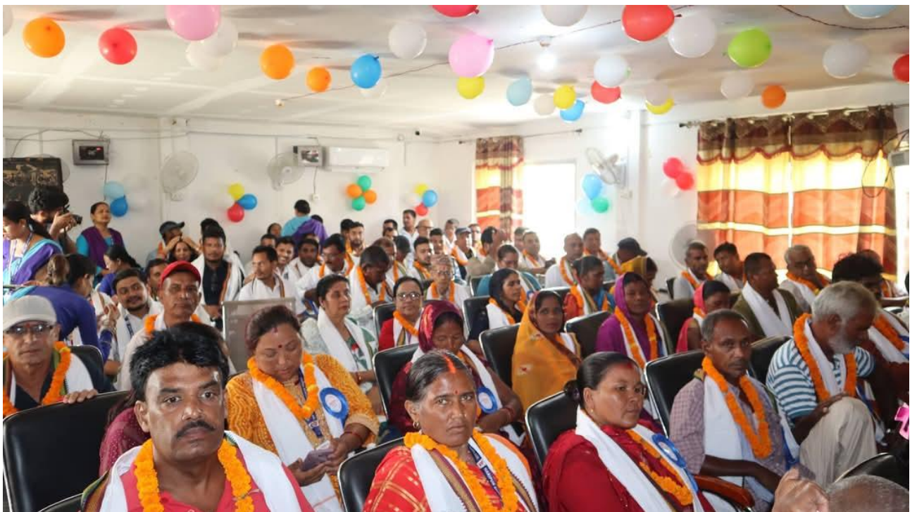
हरिपुर नगरपालिकाको तेहौं नगरसभा, २०८१ को केहि तस्बिरहरु