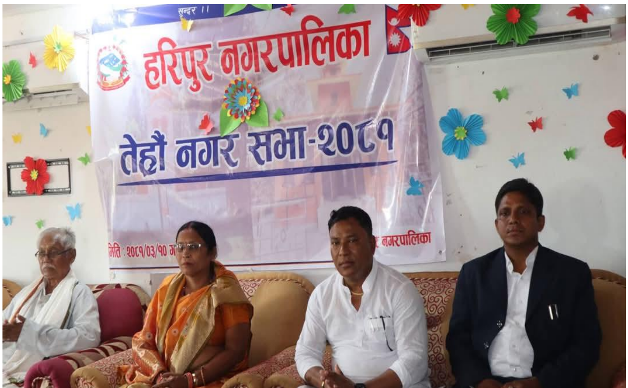
हरिपुर नगरपालिकाको तेह्रौ नगरसभा, २०८१ को केहि तस्विरहरु